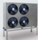
Čtyřrotorová tepelná čerpadla