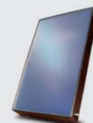
Solární kolektory se špičkovým výkonem